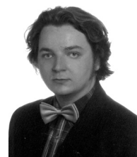
Яновский Павел (Польша). Композитор. Pawel Janowski (Poland). The composer.