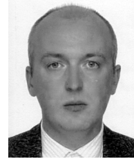
Богданов (Россия) Композитор. Bogdanov (Russia) The composer.