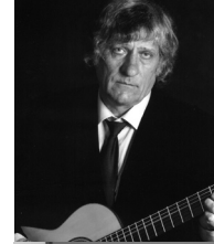
Эхин Владимир (Россия) Композитор. Ehin Vladimir (Russia) The composer.