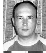
Голев (Россия) Композитор. Golev (Russia) The composer.