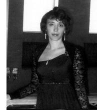
Грицаенко (Россия) Композитор. Gritsaenko (Russia) The composer.